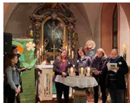
Gottesdienst zum Weltgebettag