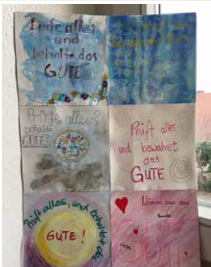
Kunst zur Jahreslosung - unserer Teens