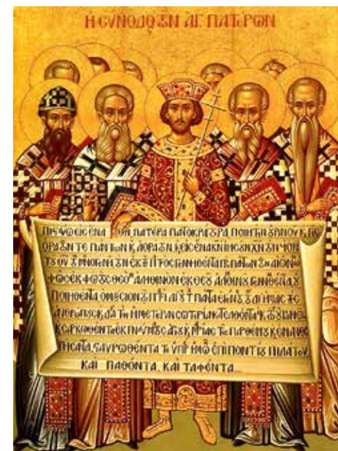
Ikone mit der Darstellung des Konzils von Nizäa: Kaiser Konstantin hält den Text des Glaubensbekenntnisses in der Hand

Darin, dass dieses Glaubensbekenntnis in allen großen Kirchen als Lehrgrundlage anerkannt ist, steckt ein großes ökumenisches Potenzial ; zugleich hat eben dieses Glaubensbekenntnis aber auch bis heute eine kritische Funktion gegenüber der tatsächlichen Lehre und Verkündigung der