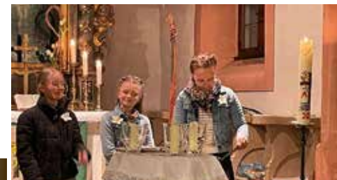
Gottesdienst zum Weltgebettag von den Cookinslen (WGT)