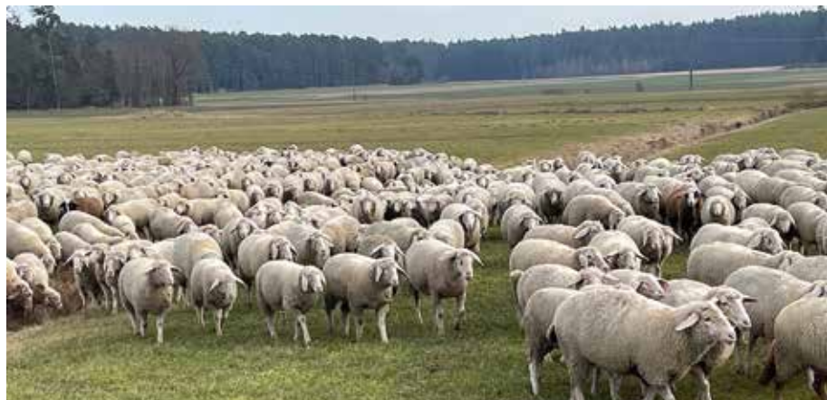
Der Herr ist mein Hirte - Schafe in Dürrenmungenau