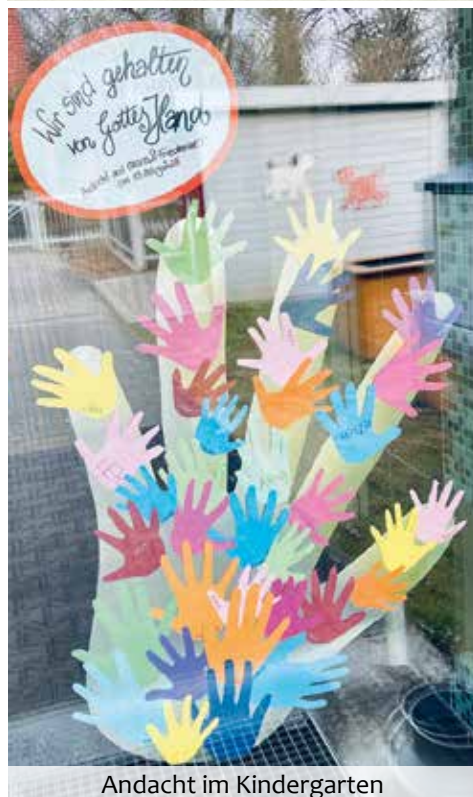
Andacht im Kindergarten