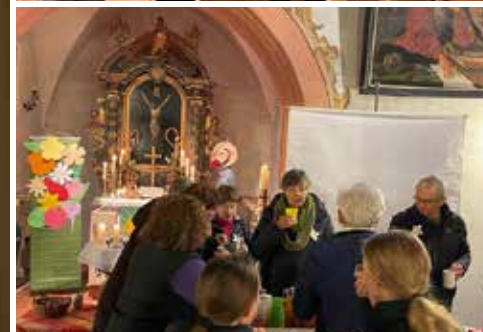
Gottesdienst zum Weltgebettag (WGT)