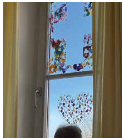
Schöner Ausblick aus unserem Kirchturm in Aberg - mit Symbolen