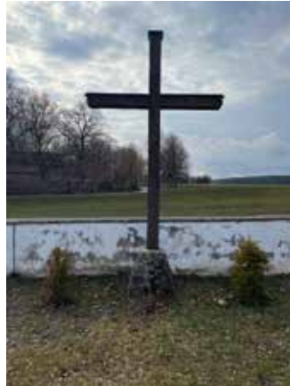
Ort für die pflegelosen Urnengräber

Der Kirchenvorstand hat bereits Ende vergangenen Jahres beschlossen, dass es ab 1.1.2025 die Möglichkeit einer pfelegelosen Bestattung gibt. Unter dem großen Kreuz im neuen Friedhofsteil (s. Bild) werden nun Plätze für Urnengräber freigehalten und rechts davon für Erdbestattungen, bei denen die Gräber ausschließlich mit Wiese bedeckt werden. Ein kleiner Grabstein mit Name und Lebensdaten der verstorbenen Person wird so plaziert, das unsere Friedhofspfleger mühelos mit dem Rasenmäher darüber mähen können.