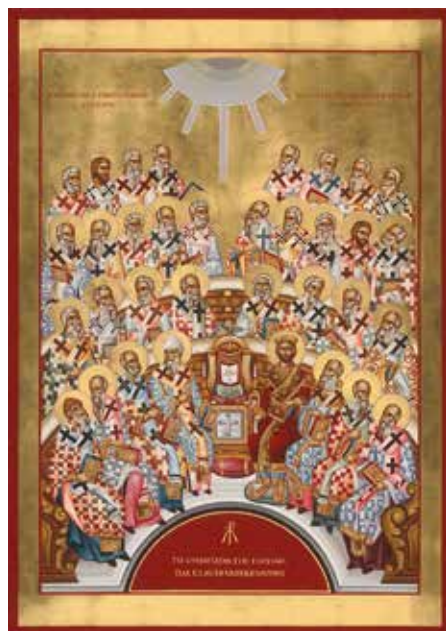
Nizäa-Ikone 2025, zeitgenössisch gemalt von Anastasios Voutsinas und Eleni Voutsina, Thessaloniki 2024. Die Ikone ist eigens für das Jubiläumsjahr 2025 geschrieben worden.

Denn das Glaubensbekenntnis von Nizäa wurde auf dem folgenden ökumenischen Konzil in Konstantinopel im Jahr 381 erweitert, vor allem auch durch weitere Aussagen über den Heiligen Geist. Im Konzil von Chalcedon wurde der Text die-