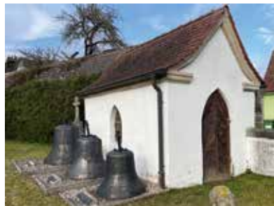
Das alte Leichenhaus.