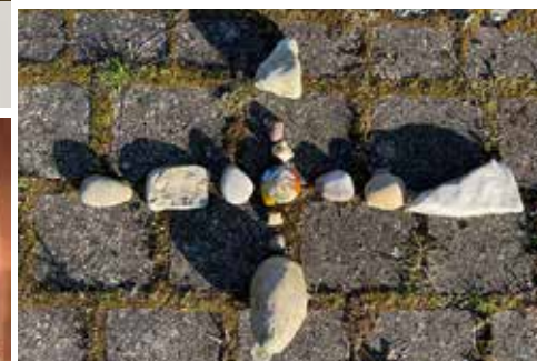
Kreuz der Liebe - unserer Konfirmanden