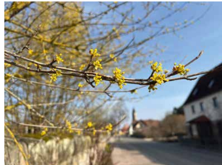
St. Andreas in weiter Ferne ...? – Wann werden wir dort wieder »die schönen Gottesdienste des HERRN« schauen (Psalm 27,4) und feiern können?