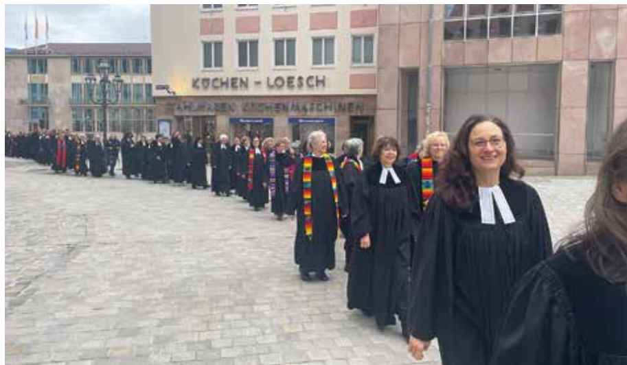
50 Jahre Frauenordination, FT