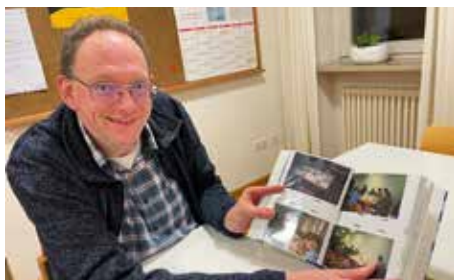
Vorbereitungen für das 30 jährige Jubiläum von St. Johannis