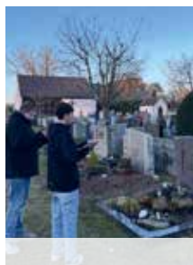
Konfirmandentreffen in Dürrenmungenau