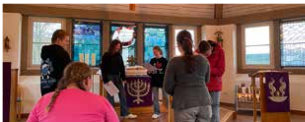
Vorbereitung des Konfirmandengottesdienstes „Our Mission“